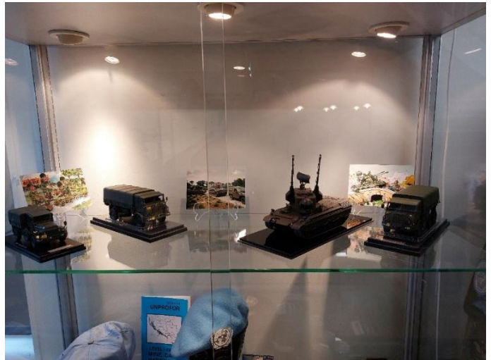
Modelvoertuigen in de vitrine

Uiteraard zijn er in de loop van de afgelopen 100 jaren vele voertuigen in Ede de revue gepasseerd. Hiervan zijn er wel meer in 1:35 formaat te krijgen. Helaas is onze ruimte beperkt en houden wij het vooral nog bij deze recentere modellen.