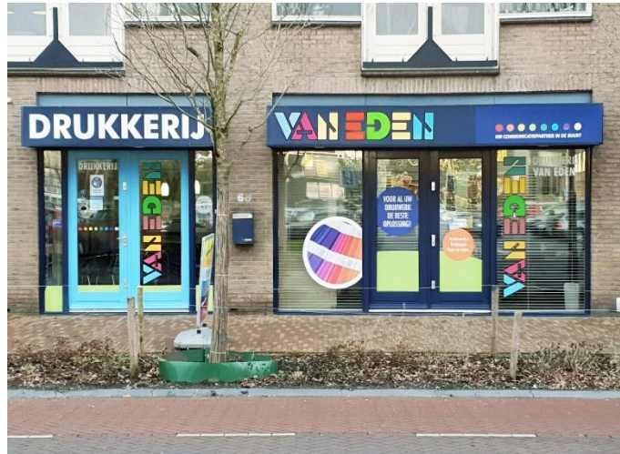
Het pand van drukkerij Van Eden aan de Telefoonweg 68.

Omdat wij het belangrijk vinden dat de Tweede Wereldoorlog voor toekomstige generaties betekenisvol blijft en de militaire historie van Ede doorgegeven blijft worden, hebben wij besloten sponsor te worden van de Stichting Militaire Historie Ede.”