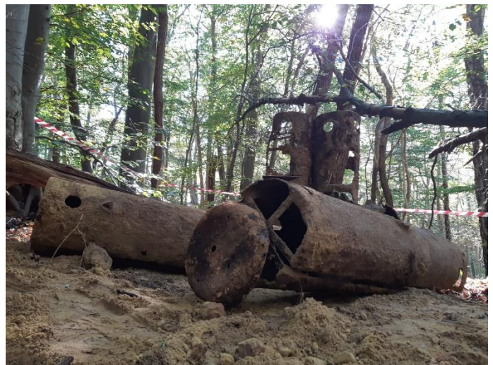
De bij Renkum gevonden CLE-Containers.

De container werd naar de Central Landing Establishment (CLE) genoemd. Het kon wapens, munitie, rantsoenen, medische apparatuur, radio's en zelfs de kleine Welbike motorfiets bevatten.