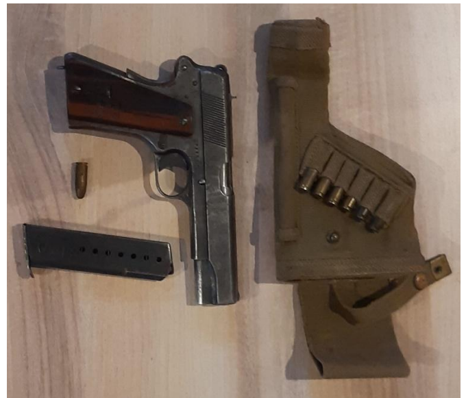
Pistool Radom Vis 35

In 1936 wordt dit wapen in gebruik genomen als het standaardpistool van Poolse infanterie- en cavalerie-officieren. Medio 1938 wordt het geïntroduceerd bij de gepantserde eenheden en de Poolse luchtmacht. Tot aan de Duitse invasie van Polen op 1 september 1939 worden ongeveer 50.000 stuks aan het leger geleverd.