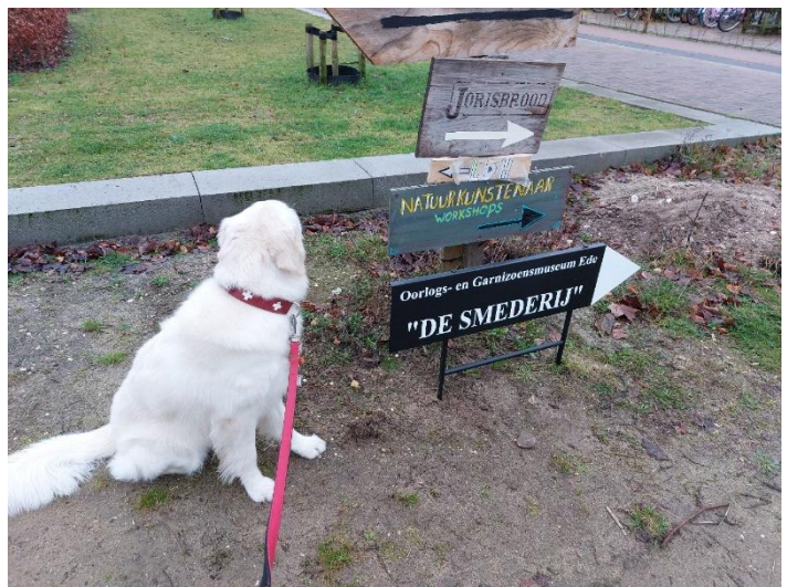
De nieuwe verwijfsborden naar De Smederij.