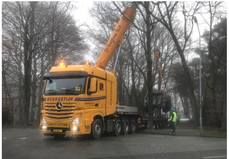
De Sherman tank wordt met groot materieel verplaatst.

Wat is er aan de hand? Is 'Sherman' een in de huidige tijd in ongenade gevallen generaal uit de Amerikaanse burgeroorlog, waarvan alle herinneringen nu uit het straatbeeld verwijderd moeten worden? Moet het gevaarte wijken voor huizenbouw? Worden mensen zenuwachtig van de loop van het kanon, die naar het centrum wijst?